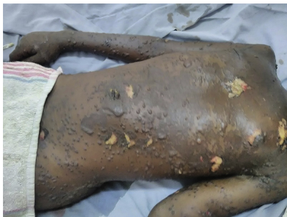
Figura 1. Lesiones ampollosas generalizadas de aparición rápida, despegamiento cutáneo evidente y signo de Nikolsky positivo. Cuadro clínico indicativo de necrosis epidérmica tóxica. La retirada del medicamento causal mejora el pronóstico vital.